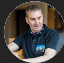
ALEXANDER ENTENSPERGER EINIG GERÄTEBAU & GRAVUREN GMBH

„Mașinile HURCO pot fi programate ușor pe baza desenului și ne permit să respectăm standardele noastre de calitate – o valoare de neprețuit”.